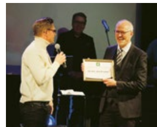
Umeå Pingst mottar diplom för sin omfattande insats för de mest utsatta.

PMU blickar både bakåt och framåt när man firar 60 år som biståndsaktör. Tillsammans med många av pingst-rörelsens församlingar har organisationen engagerat sig och stöttat demokratiprojekt, folkbildning, katastrofhjälp, hälsovård, barns utbildning, tillgång till vatten, fredsarbete,