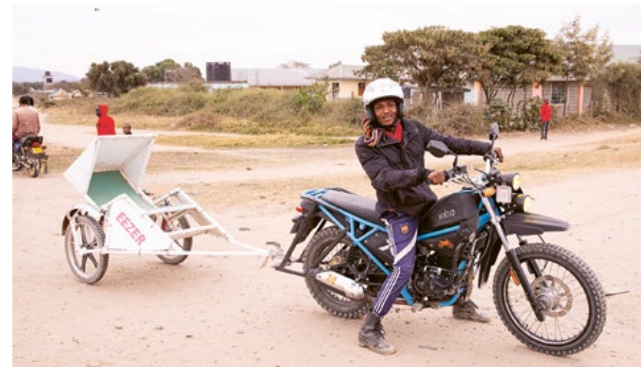
I Kenya åker hälften av alla kvinnor som ska föda på lokala kliniken Mile46 med mc-ambulans med hjälp av PMU och Eezer Sverige. Men det finns fler att nå – många föder fortfarande hemma.