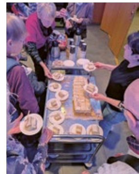
Uppsala pingst bjöd på 60-årstårta.