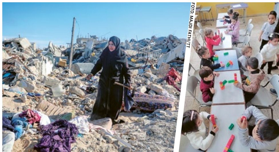
PMU:s partner förser människor med direkt humanitär hjälp såsom mat och mediciner men erbjuder även utbildning för 190 barn i en kyrka i Gaza City.