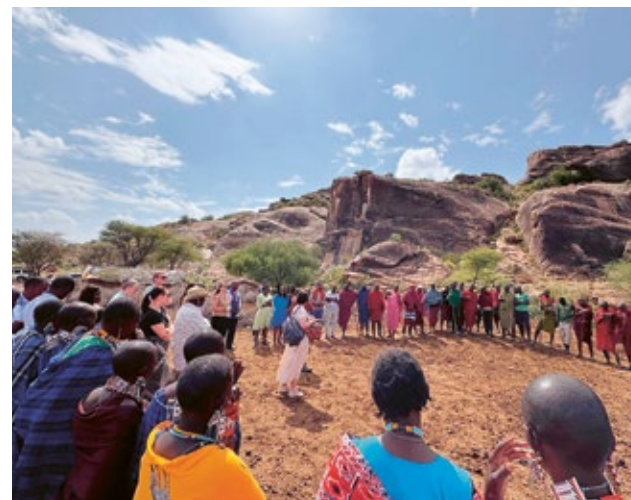
Alla i en av massajbyarna i Olgulului samlas för att gemensamt välkomna de svenska besökarna.

procent fler patienter besöker mödravårdsklinikerna i Mugu som ligger i Himalayabergen i Nepal. PMU:s partner UMN har också sett en 66 procentig ökning av användandet av preventivmedel. Ökningen ses mellan år 2021-2023 som ett resultat av det arbete för tillgång till grundläggande hälsovård som UMN bedrivit i området.