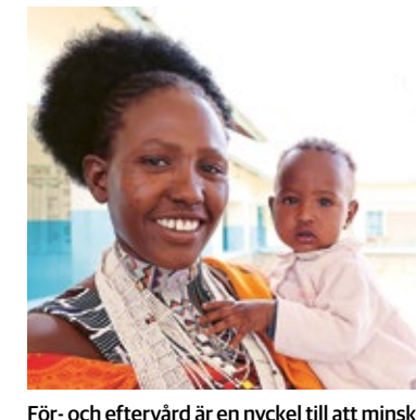
För- och eftervård är en nyckel till att minska mödradödligheten.

Vill du vara med och göra skillnad? Swisha din gåva till 9000506 och märk med "mödravård" och var med och stötta PMU:s partner som arbetar för att fler kvinnor ska få tillgång till en god hälsovård och mödravård.