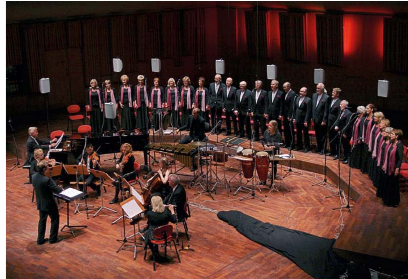
Aspnäs kyrkans kammarkör har under hösten och vintern stöttat PMU:s Barnens rätt-kampanj.