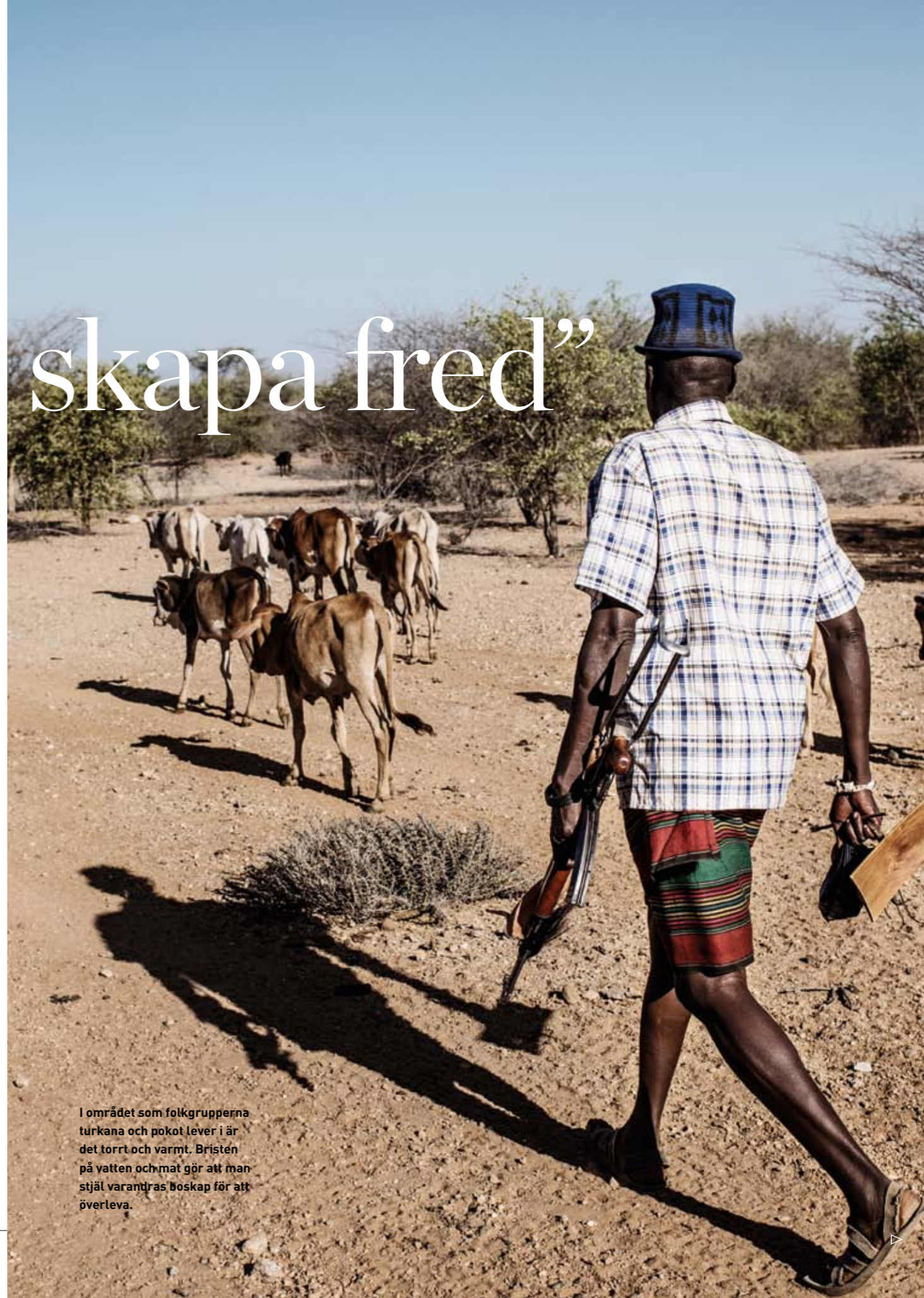
I området som folkgrupperna turkana och pokot lever i är det torrt och varmt. Bristen på vatten och mat gör att man stjälar varandras boskap för att överleva.