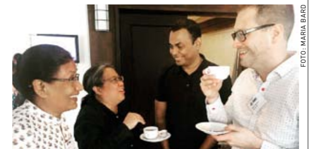
Under fikarasterna fanns tid för samtal och diskussion.