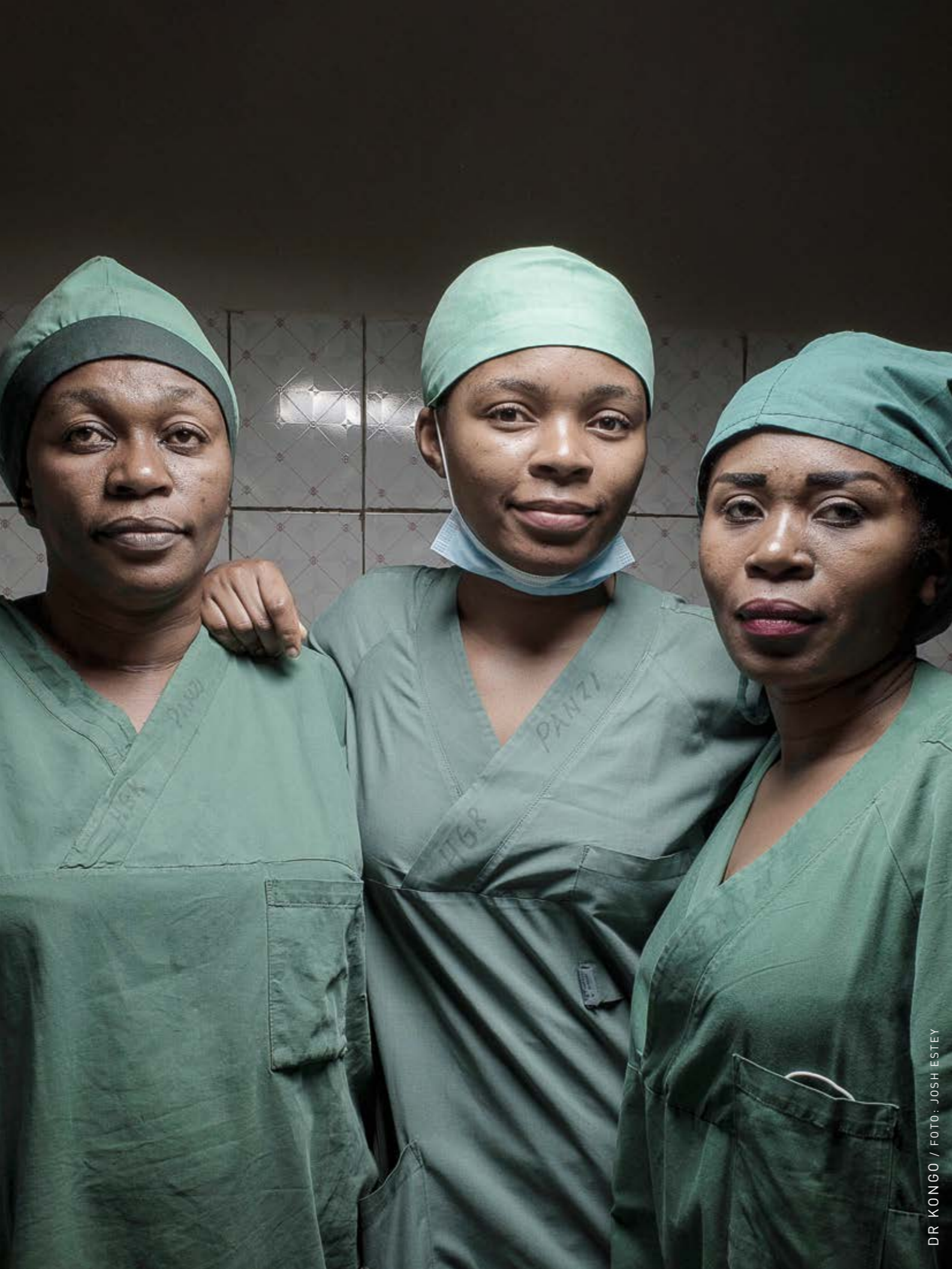
DR KONGO