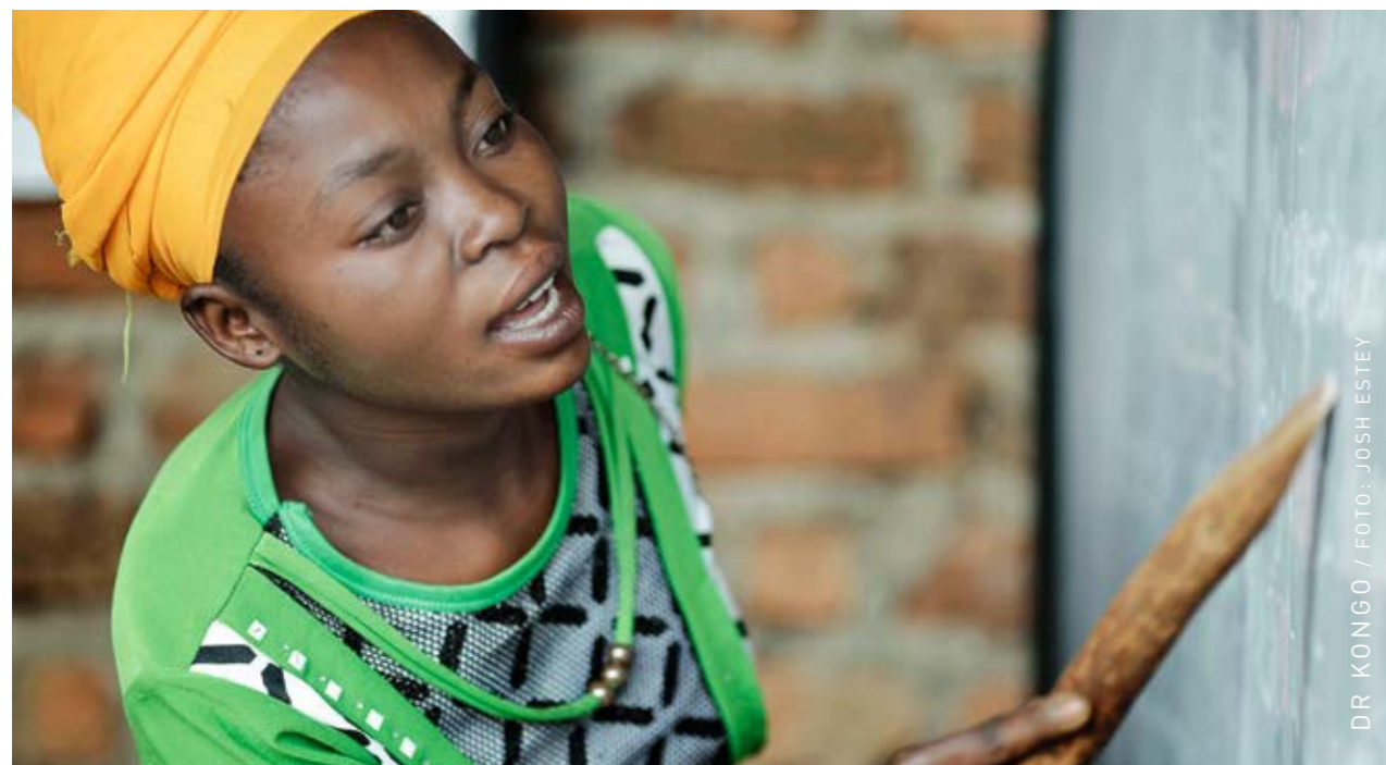
DR KONGO