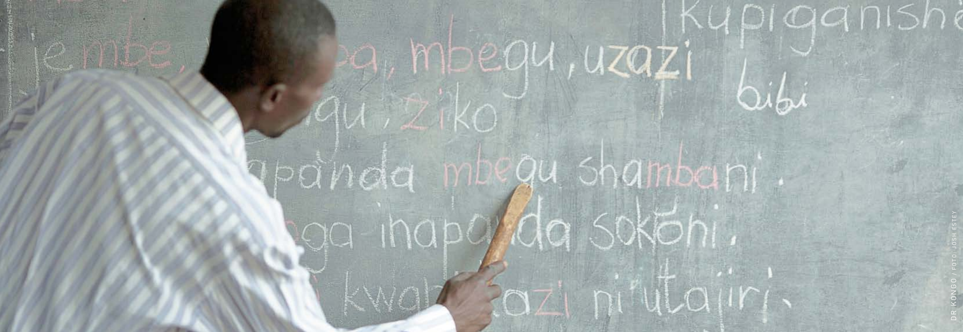
DR KONGO