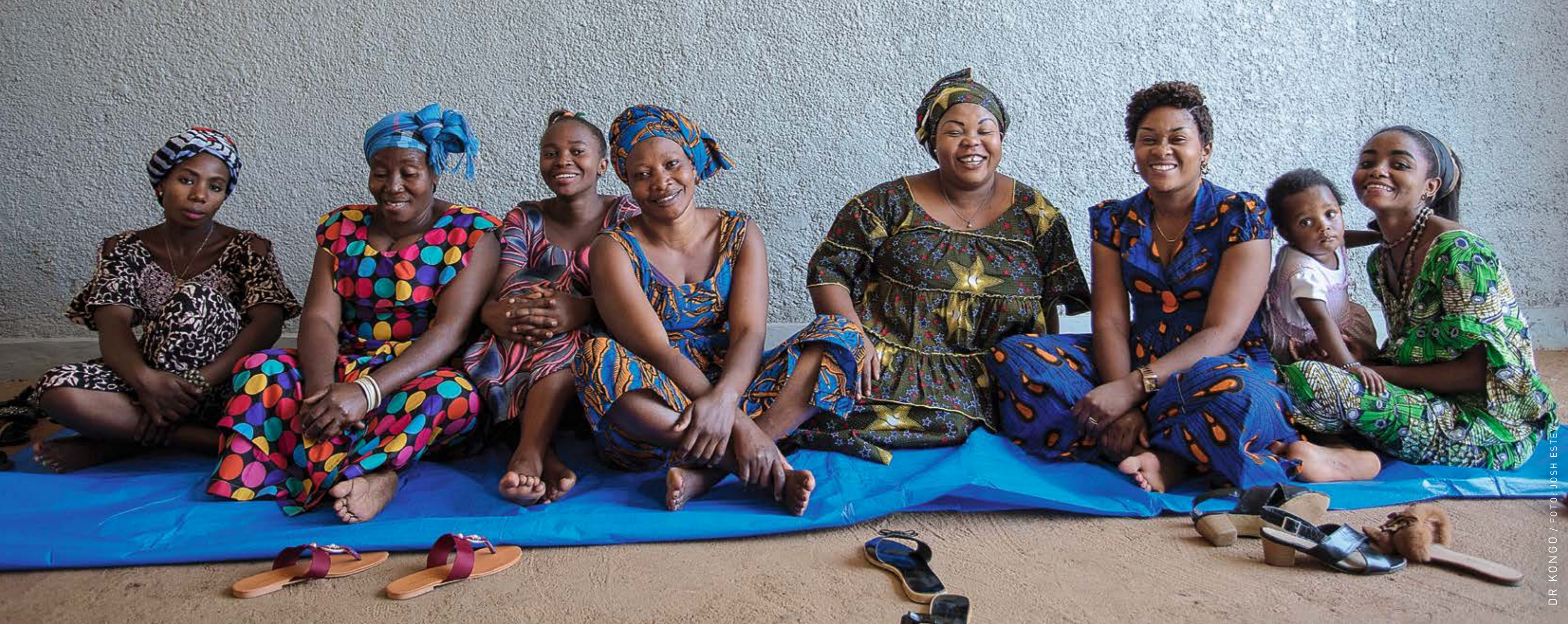
DR KONGO