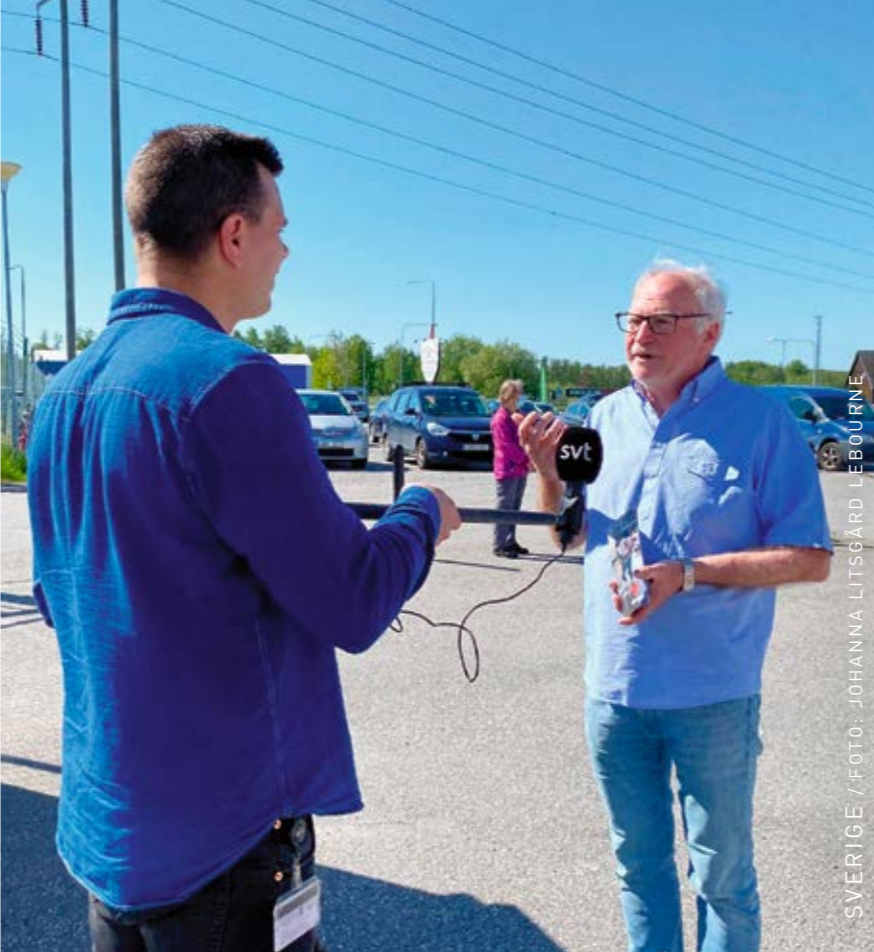
SVERIGE / FOTO: JOHANNA LITSGÅRD LEBOURNE